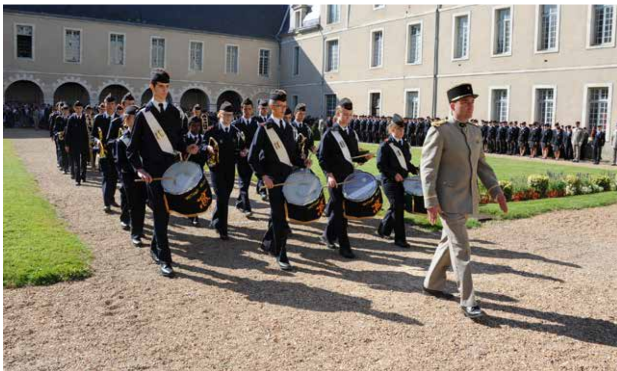
La fanfare de l'école, la whà