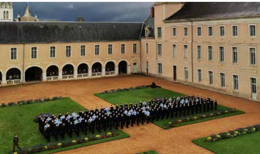
La cour d'Honneur du Prytanée