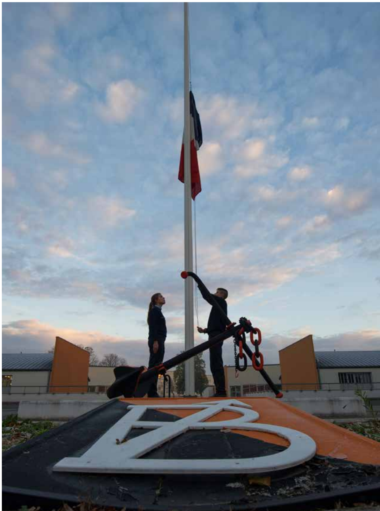
La montée des couleurs