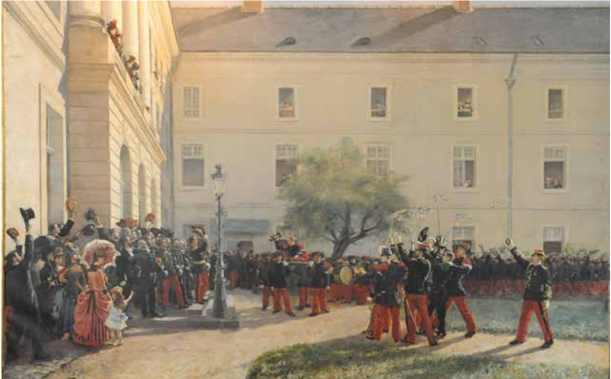
Le triomphe du prix d'Honneur