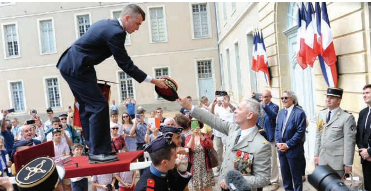
Échange de coiffures pour le prix d'Honneur