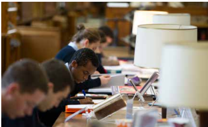
Étude à la bibliothèque