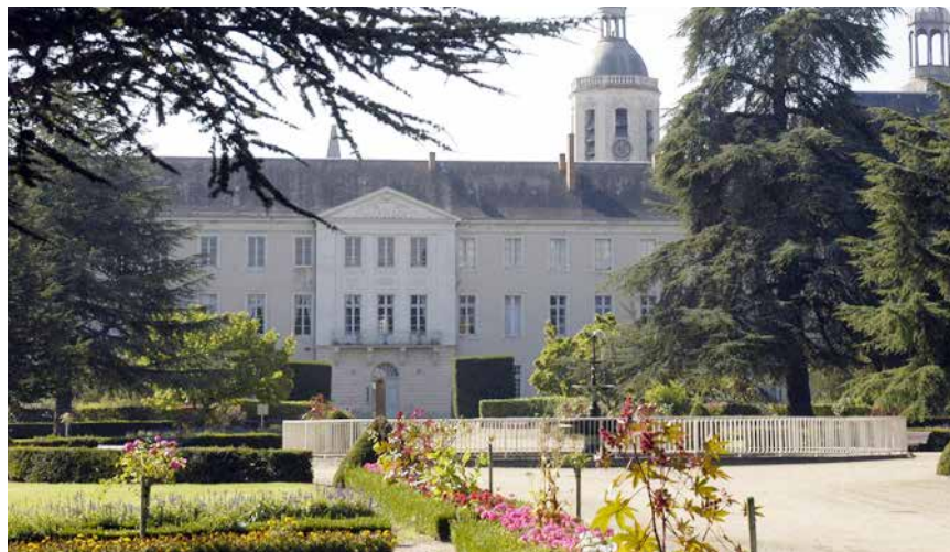
Le parc du quartier Henri IV

En 2020, le Prytanée national militaire a été classé, cette année, 1 er de l'Académie de Nantes, 5 e meilleur lycée public de France et 33 e dans le palmarès des 100 meilleurs lycées publics et privés de France (classement-lycees.etudiant.lefigaro.fr), avec 100% de réussite au Baccalauréat, toutes filières confondues, et 97% de mentions, dont 30% de mentions TB. Les résultats aux concours des grandes écoles ont vu le PNM obtenir plus de cinquante-six intégrations toutes écoles confondues, dont une vingtaine à l'École Navale, et un intégrant à l'École polytechnique. Ceci laisse présager de bons, voire de très bons résultats pour 2021. Classes préparatoires à l'enseignement supérieur (CPES) : ouvertes à tous, sélection sur dossier. Les élèves boursiers méritants disposent de places prioritaires pour ces classes préparatoires. L'inscription en classes préparatoires se fait par le biais de Parcoursup. Les meilleurs dossiers sont retenus (logique d'aide au recrutement).