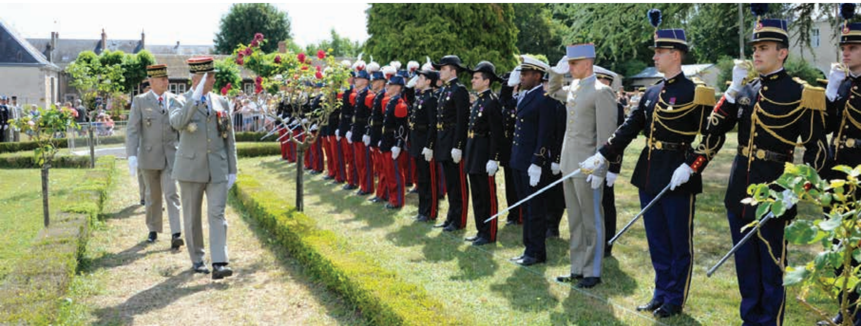
Le CEMA lors de la fête de TRIME 2019

ainsi à la distance qui les sépare du lieu de résidence familial. Ce système d'internat longue durée garantit aussi des études surveillées et accompagnées le soir, mais également des activités sportives intensives au sein du lycée et surtout une cohésion avec la chambrée, la classe ou les amis, qui les suivra tout au long de leur vie. Ces conditions d'excellence répondent à la fois aux besoins académiques, de santé et de vie sociale des élèves.