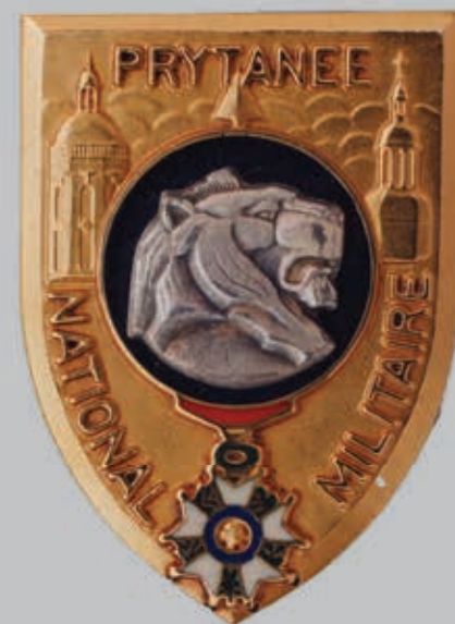
Insigne du Prytanée

professionnelles sont de plus en plus nombreuses. Par ailleurs, dans une moindre mesure, des places (jusqu'à 15%) sont également réservées aux enfants de fonctionnaires titulaires de la fonction publique dont certaines professions génèrent des contraintes fortes et aux boursiers de l'Éducation nationale (jusqu'à 15%) dans le cadre du plan «Égalité des chances».